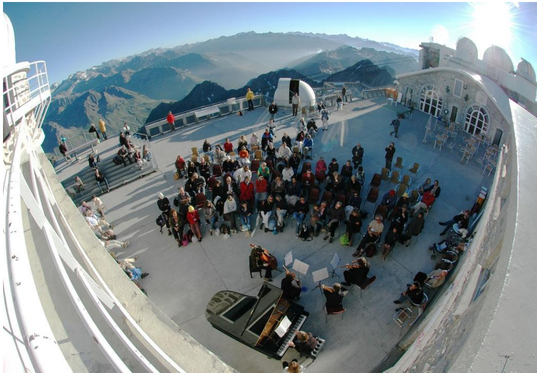
Concert au sommet du Pic du Midi (2008)