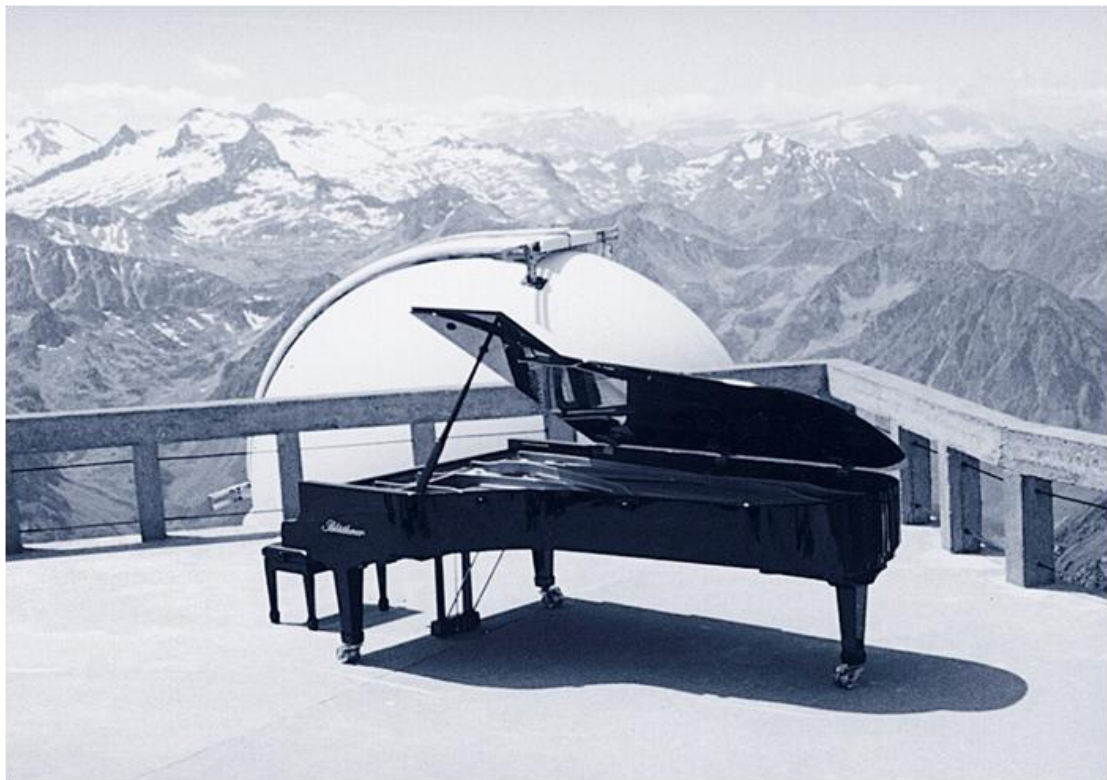
Installation au sommet du Pic du Midi (1997)